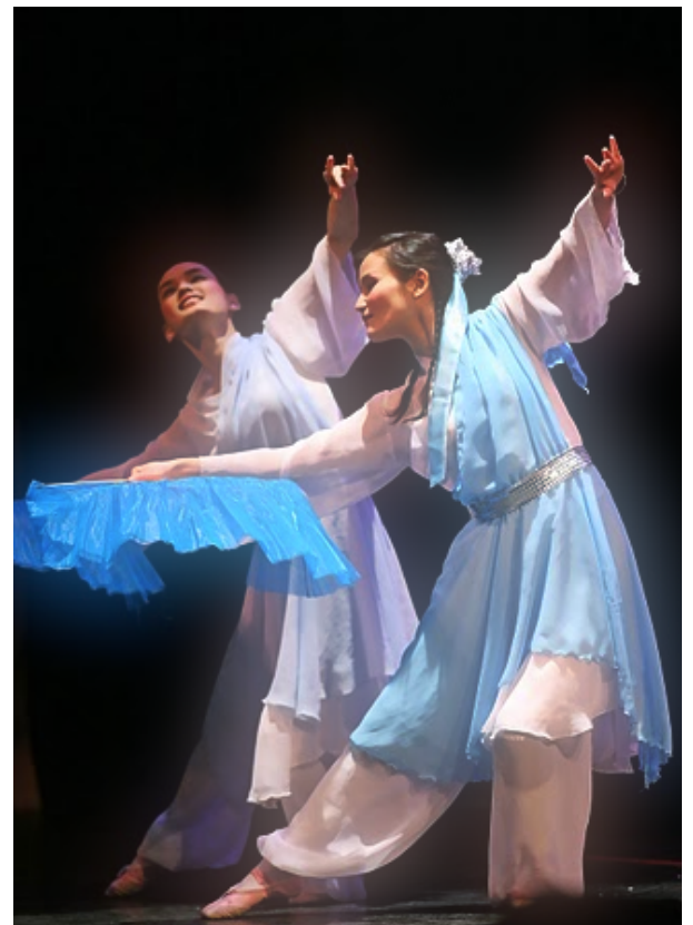
杜克情,中国魂,点睛一笔是蛟龙。

在此，DCSSA对所有积极关注我们成长和热心帮助我们文化形象构建的老师、同学和校友们表示最诚挚的谢意！